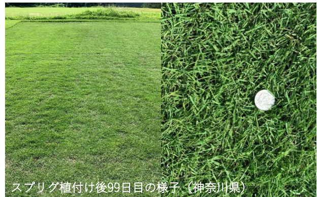
スプリング植付け後99日目の様子（神奈川県）