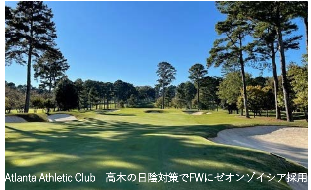
Atlanta Athletic Club 高木の日陰対策でFWにゼオンゾイシア採用