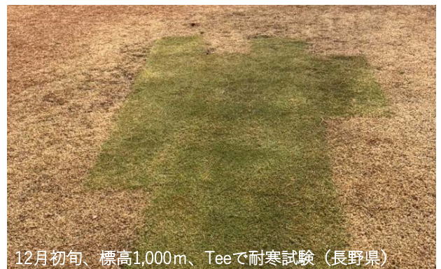
12月初旬、標高1,000m、Teeで耐寒試験（長野県）

右写真：標高1,000m以上の高地での試験 12月初旬、周囲の野芝は休眠しているが ゼオンゾイシアは緑度を保っている